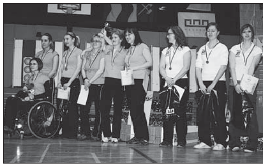
Družstva žen Ostrava

Na víkend se dorostenečtí lukostřelci sjeli téměř do